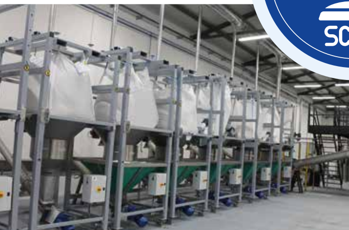
Recente investimento: nuova linea produttiva automatizzata