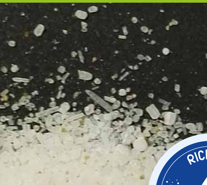
Materie prime purissime

IDROCOMPLEX NEW: i fertirriganti di qualità sono MADE in SCAM