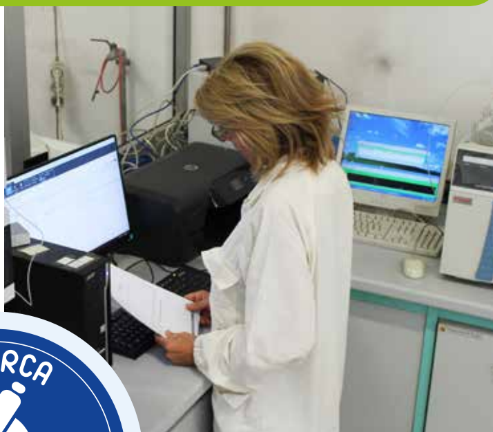
Messo a punto dalle formulazioni e controllo qualità nel laboratorio SCAM